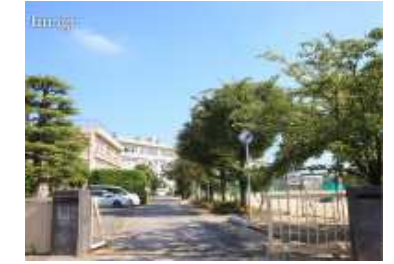
市立柏第3中学校(約330m)