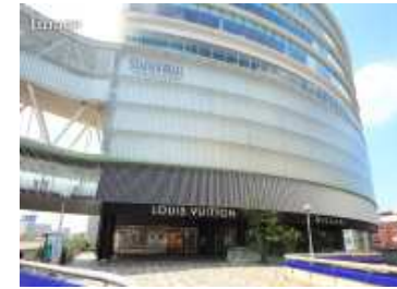
柏高島屋ステーションモール(約1,350m)