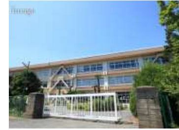
市立柏第7小学校(約420m)