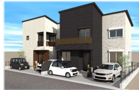
サンヨーホームズ 建物参考プラン