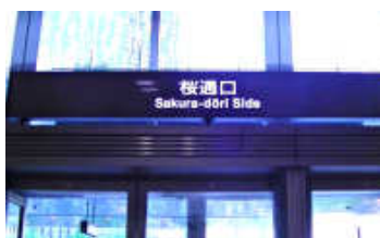
名古屋駅の桜通口から出て左方向へすすみます。