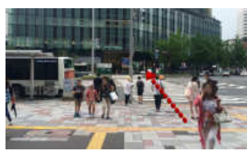
正面に大名古屋ビルディングが見える横断歩道を渡ります。