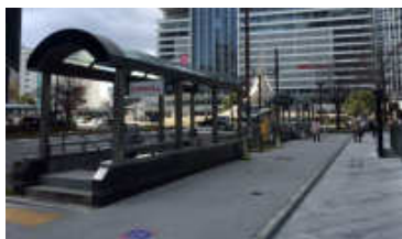
ユニモール2番出口がございます。地下鉄降り口からですと地下を通過して、ユニモール2番出口よりお上がりください。