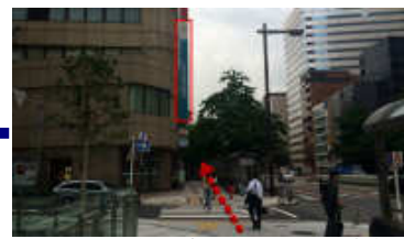
三井住友信託銀行が見えたらそのまま直進し横断歩道を渡ります。