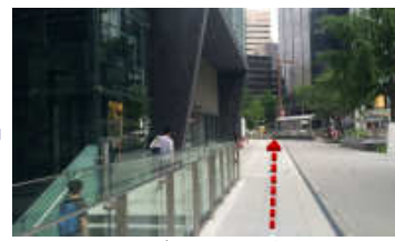
左手に大名古屋ビルの通りを進みます。