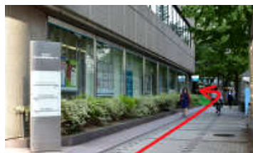
KDX名古屋駅前ビルの前を進み、左へ曲がります。