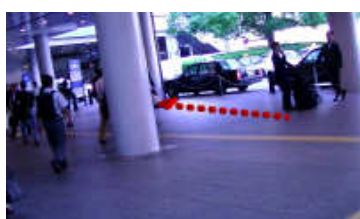
左へ歩道に沿って進みます。