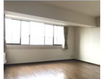
リビングダイニング (現況)