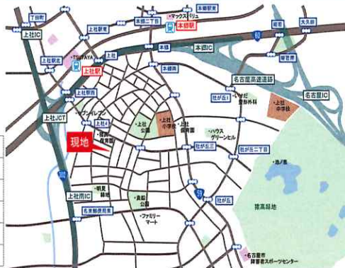
インターネット・カーナビ検索 名古屋市名東区上社4丁目271番地