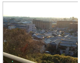
2階バルコニー風景