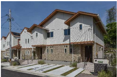
■物件所在建物外観(左住戸)