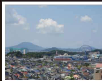
▲南側：マリノアシティ観覧車