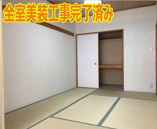
全室美装工事完了済み