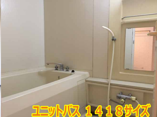
ユニットバス 1418サイズ