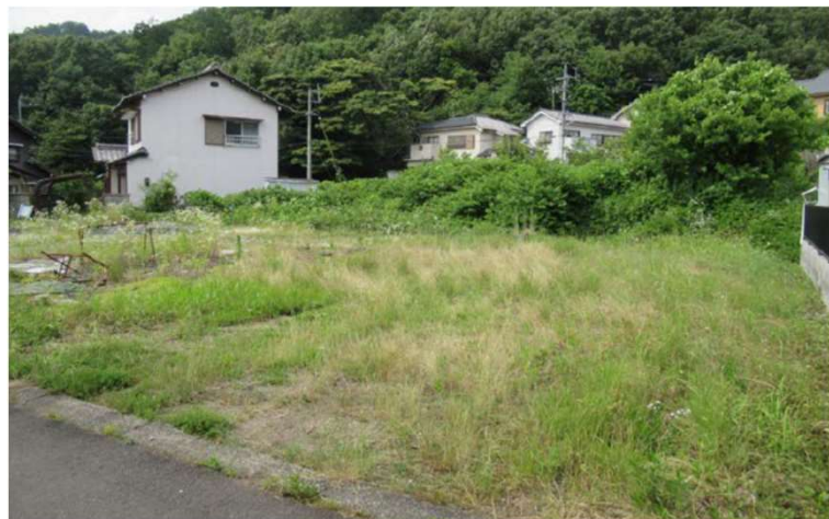
現地写真 (南側前面道路含む)