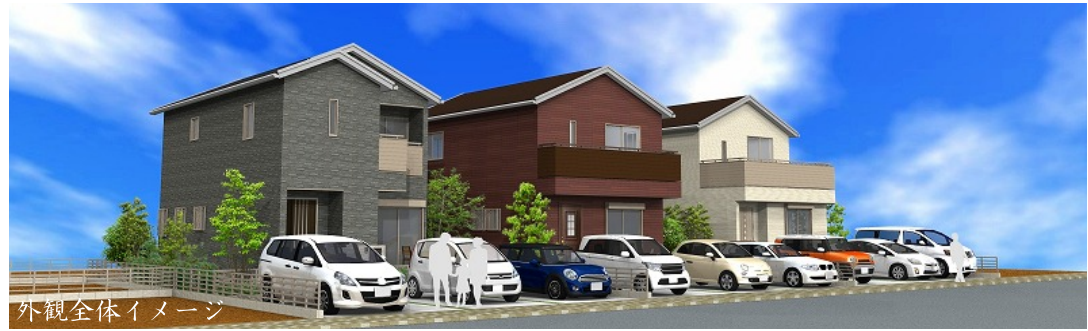
外観全体イメージ