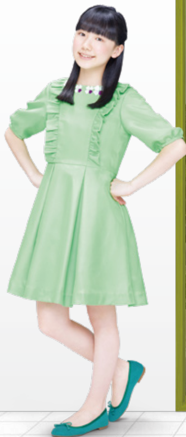
サンヨーホームズ イメージキャラクター 芦田愛菜

募集主旨： 今後、建築業界では大工 等の建築技能者が少な くなっていきます。 当社は、人材の教育や次 代を担う若い技能者の育 成を行います。