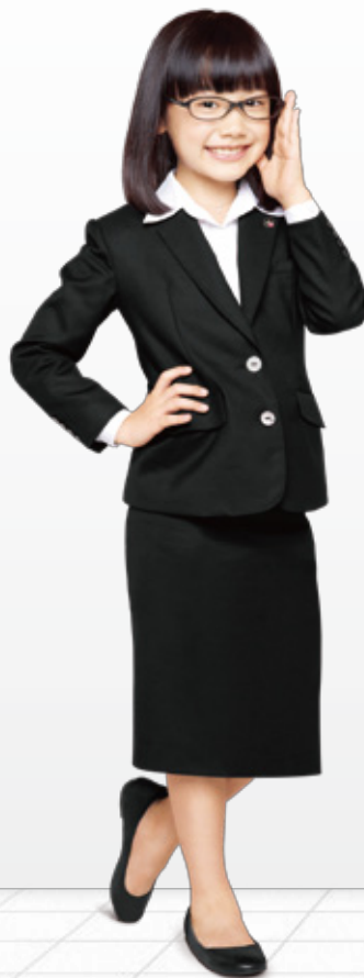
サンヨーホームズ イメージキャラクター 芦田愛菜

開校趣旨： 今後、建築業界では大工 等の建築技能者が少なくな っていきます。 当社は、人材の教育や次 代を担う若い技能者の育 成を行います。