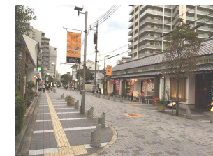
物件までは徒歩7分。風情ある街並みが続きます。