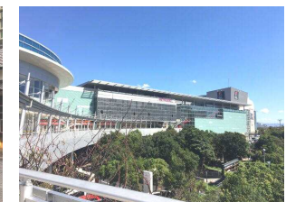
イオンモール伊丹。徒歩10分。