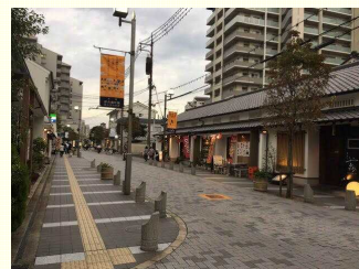
物件までは徒歩7分。風情ある街並みが続きます。