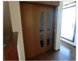
ホームエレベーター